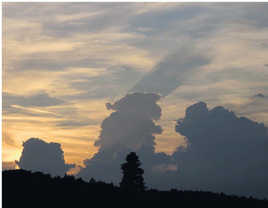
EIN TYPISCHES BILD am Sommeranfang, aufgenommen am 22. Juni in Hallwil. Am Abend wachsen grosse Gewittertürme in den Himmel, die vom Jura her ins Seetal ziehen. Solche Wetterlagen sind unbeständig, jedoch warm – ähnlich wie in den Tropen.